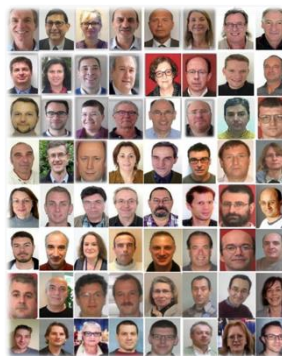
Candidates & candidats en 2019

→ Chaque salarié, quelle que soit sa catégorie professionnelle, peut apporter sa contribution et participer à la vie syndicale.