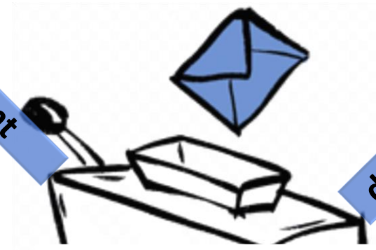
Les Titulaires CSE